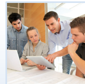
■ Schulaktionen in Betrieben