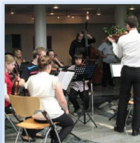
... mit einer Schulorchester- aufführung & einer Vernissage