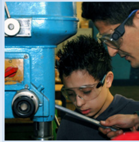
■ Praktika im Unternehmen